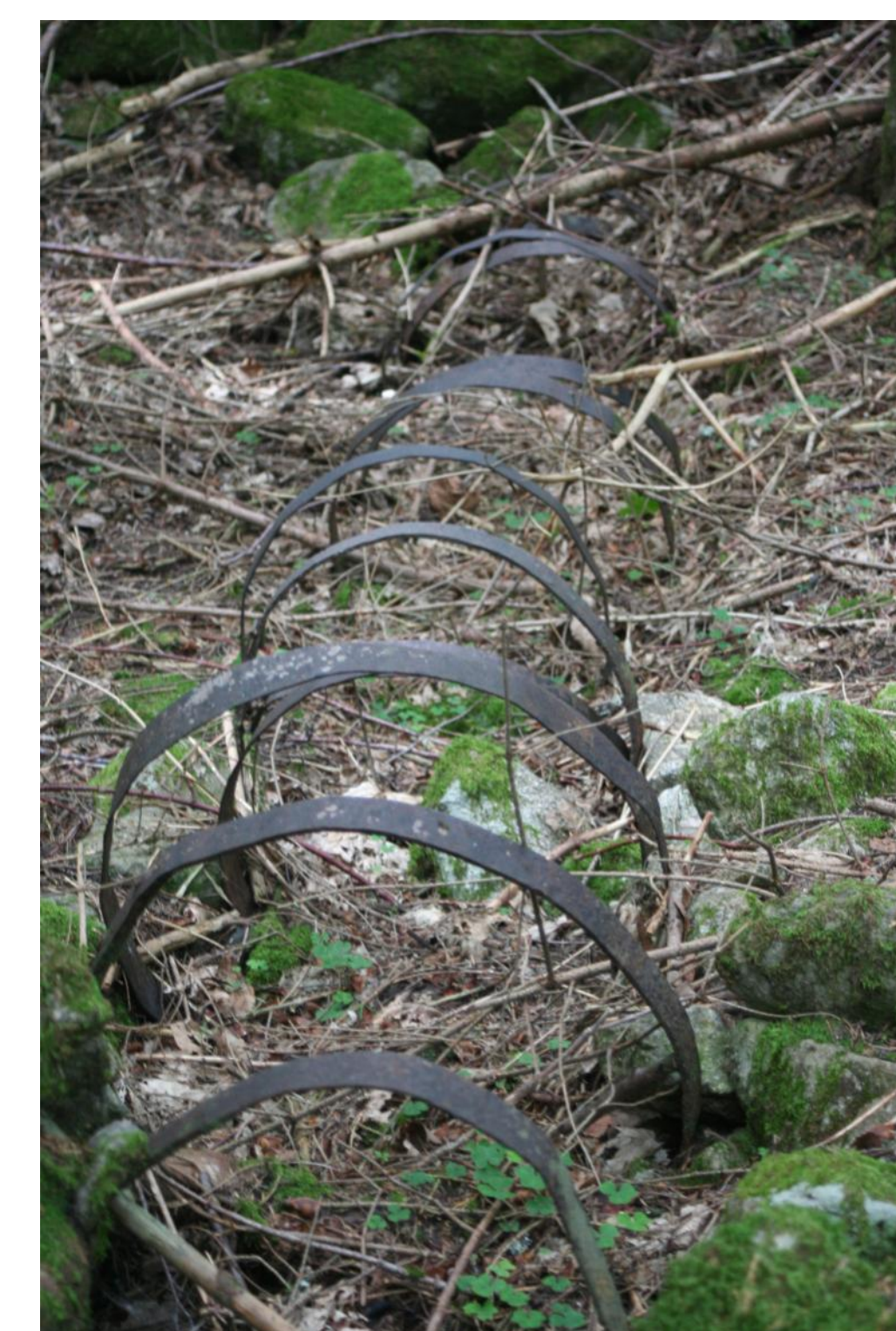
Cerclage d'une ancienne conduite forcée alimentant la scierie de la vallée du Cravassa (42)