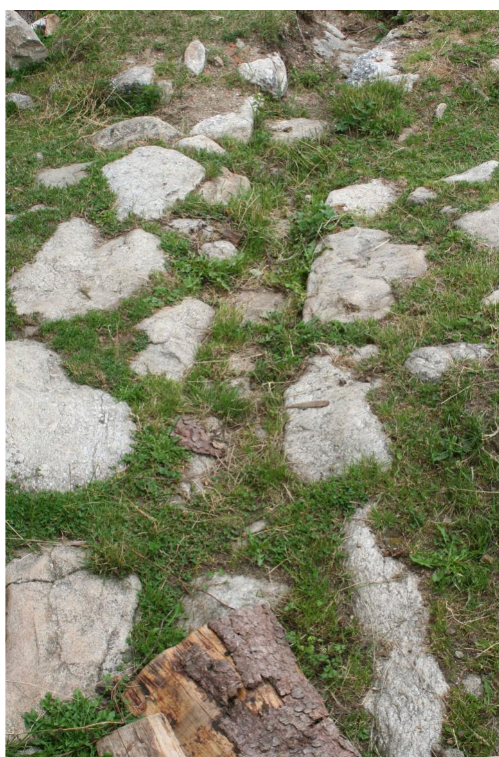
Sortie de l'étable par un caniveau bâti dans le dallage à Chassirat (42)

La conduite de l'eau affectée à ces différents usages a donné naissance à de nombreux aménagements, souvent « primitifs », parfois sophistiqués.