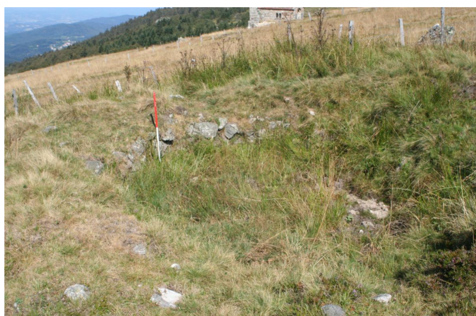
Petite serve individuelle