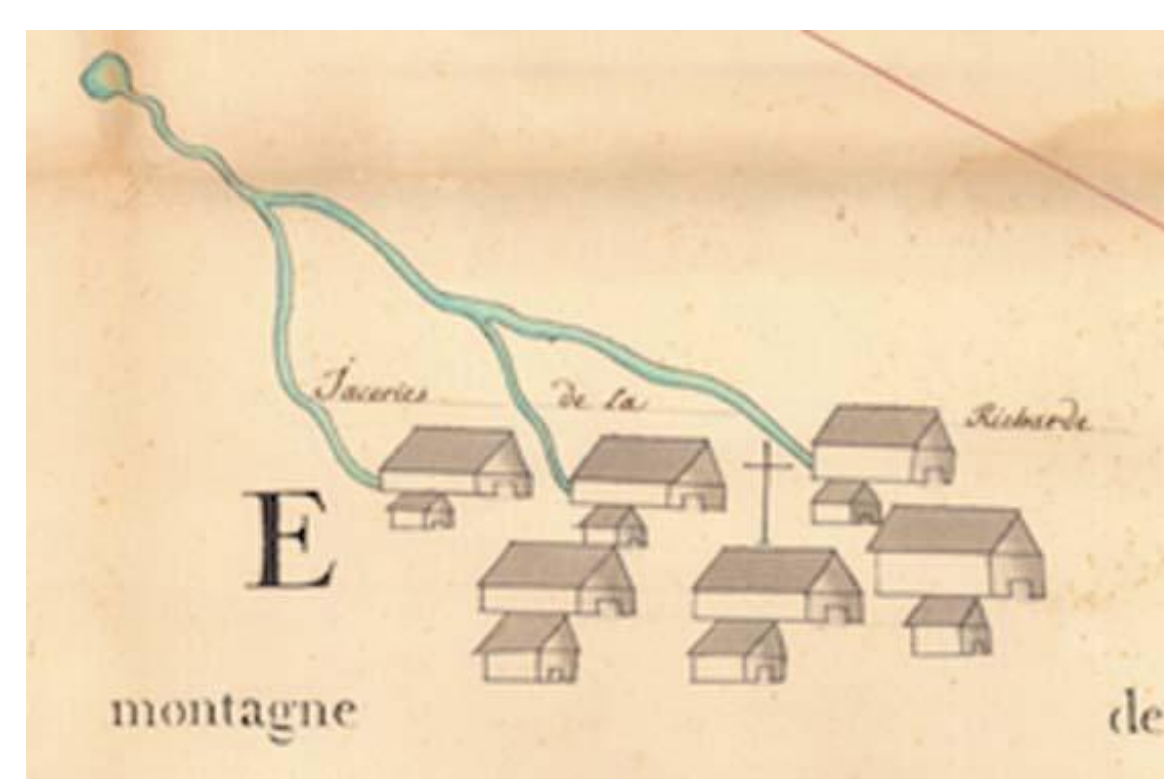
Détail d'un plan datant de 1766 représentant la Jacerie de la Richarde et son réseau hydraulique