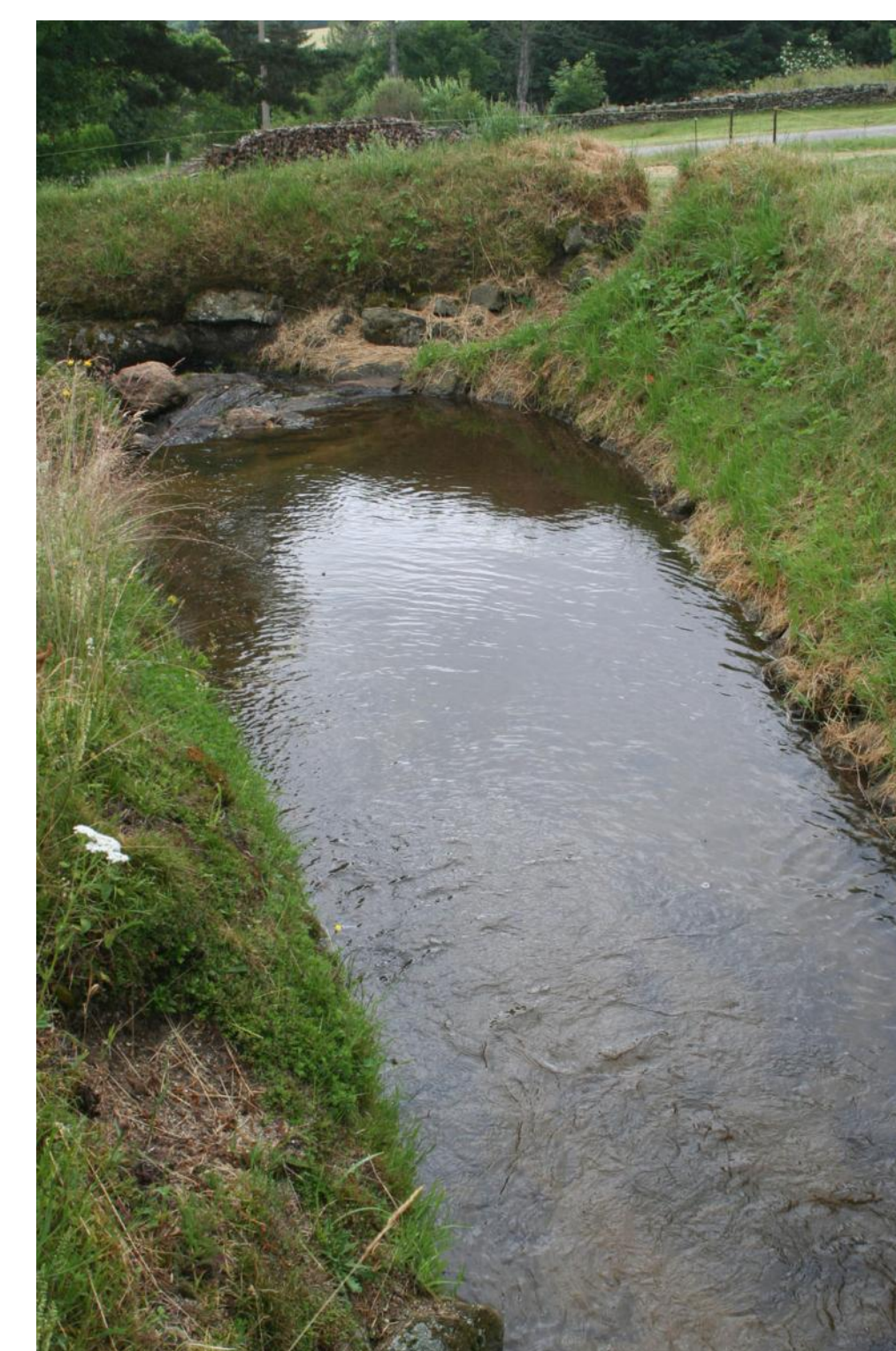
Réserve d'eau en amont des moulins du Gourre (42)

La conduite de l'eau affectée à ces différents usages a donné naissance à de nombreux aménagements, souvent « primitifs », parfois sophistiqués.