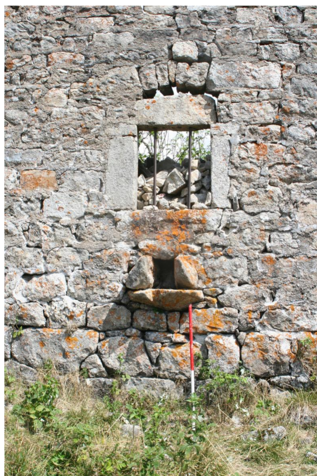
Sortie de l'étable en hauteur à la Cuchade (63)