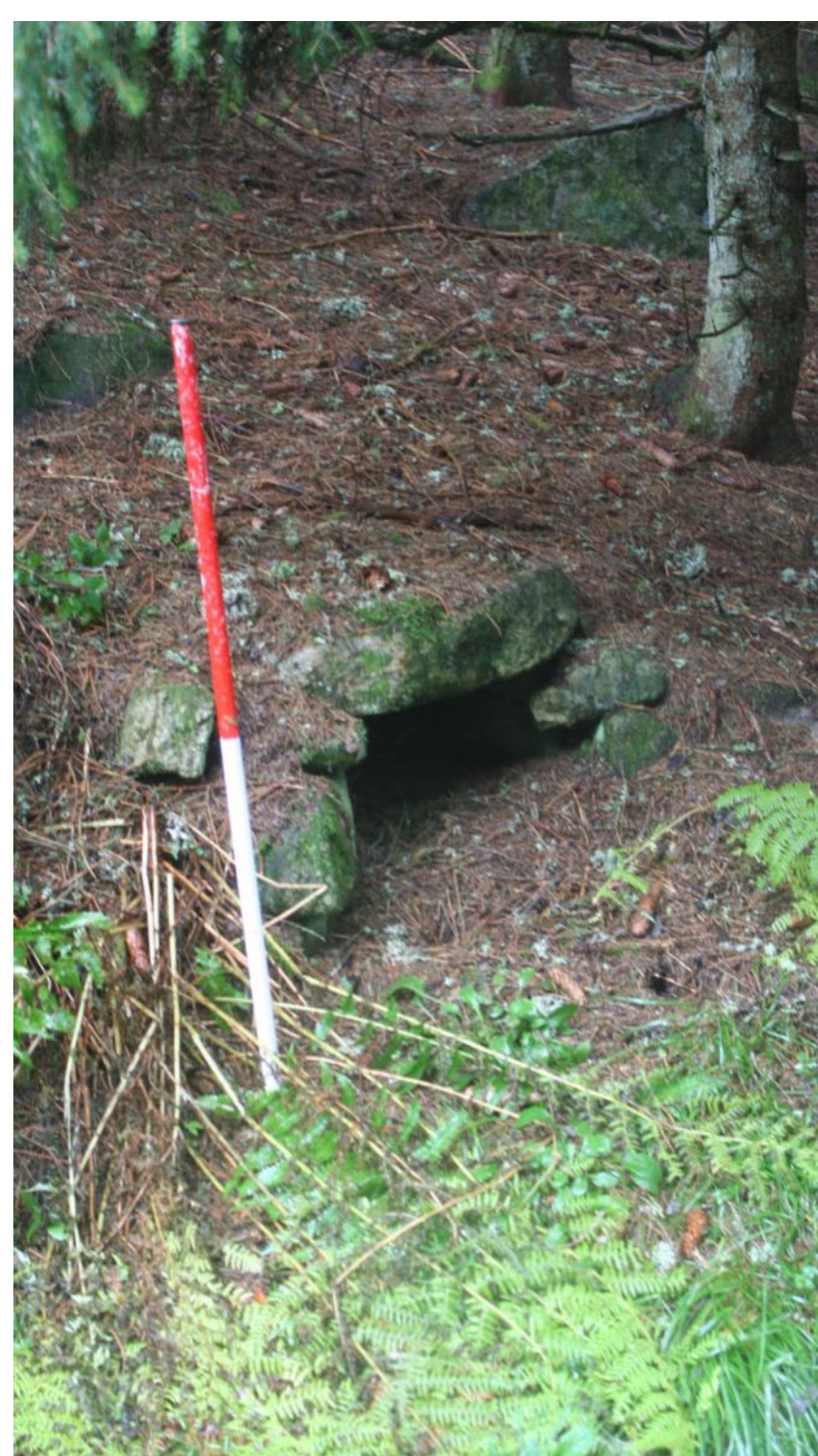
Petit caniveau enterré à la sortie du jas de Praffort (63)