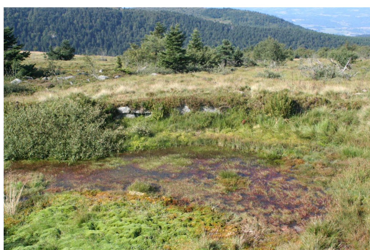
Grande serve générale